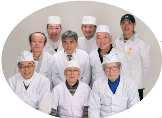
笠間のいない寿司いな吉メンバー