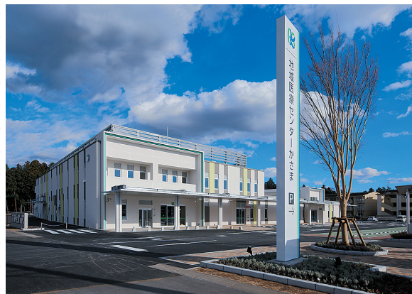
笠間市立病院へのアクセス（地域医療センターかさま内）