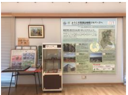
ジオパークブース