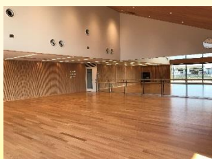
健康ふれあいルーム