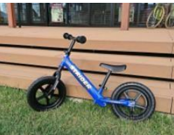
ランニングバイク