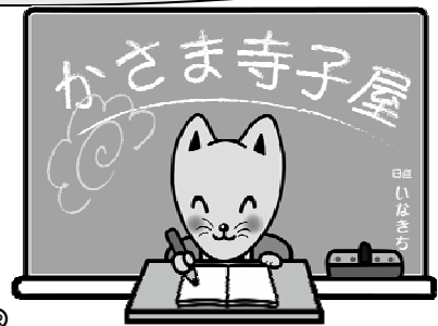
まち 笠間のいな吉®

5月～3月の毎週土曜日午前、小学5・6年生が公民館で学習します。 国語・算数・自主学习か英語、またはその両方を選べます。