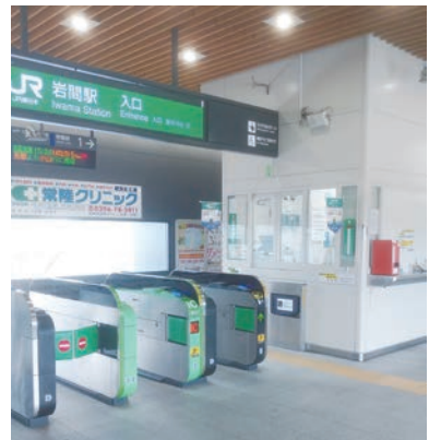
JR 岩間駅改札口付近