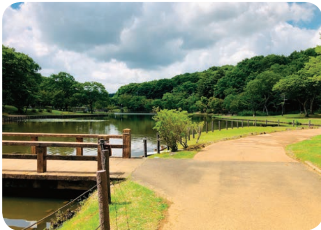
ウォーキングに適した遊歩道