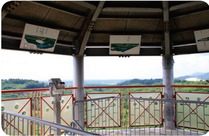
360度見渡せる最上階の展望台