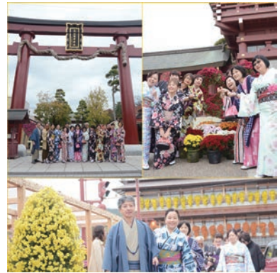
台湾からの茨城周遊ツアー参加者が和装にて門前通りを散策する様子(2018年11月13日)