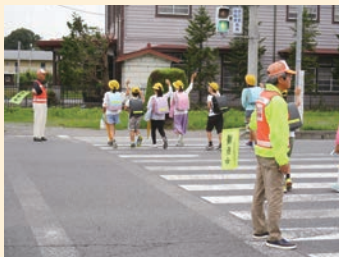
通学の安全を守る防犯ボランティア