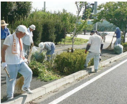
道路の清掃美化に取り組む道路里親ボランティア

答 都市建設部長 笠間地区16団体、友部地区4団体、岩間地区17団体、計37団体のボランティアの方たちに、清掃美化活