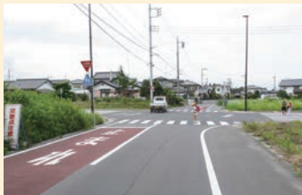
事故が多い吉岡地内の交差点

通学路で事故が多発している場所への信号の設置状況を確認し、以前から設置要望は行っているが、警察での設置本数が限られているため、なかなか実現できない実情があり、粘り強く設置の要望を行うという説明がありました。