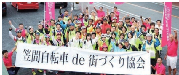
自転車活用で街に元気を！

の交通安全を推進するため制定した。自転車側の重大な過失による事故で高額な損害賠償を求められる事例が相次いで発生しており、被害者の救済と経済的負担を軽減させるために自転車保険の加入を県内初で義務化した。