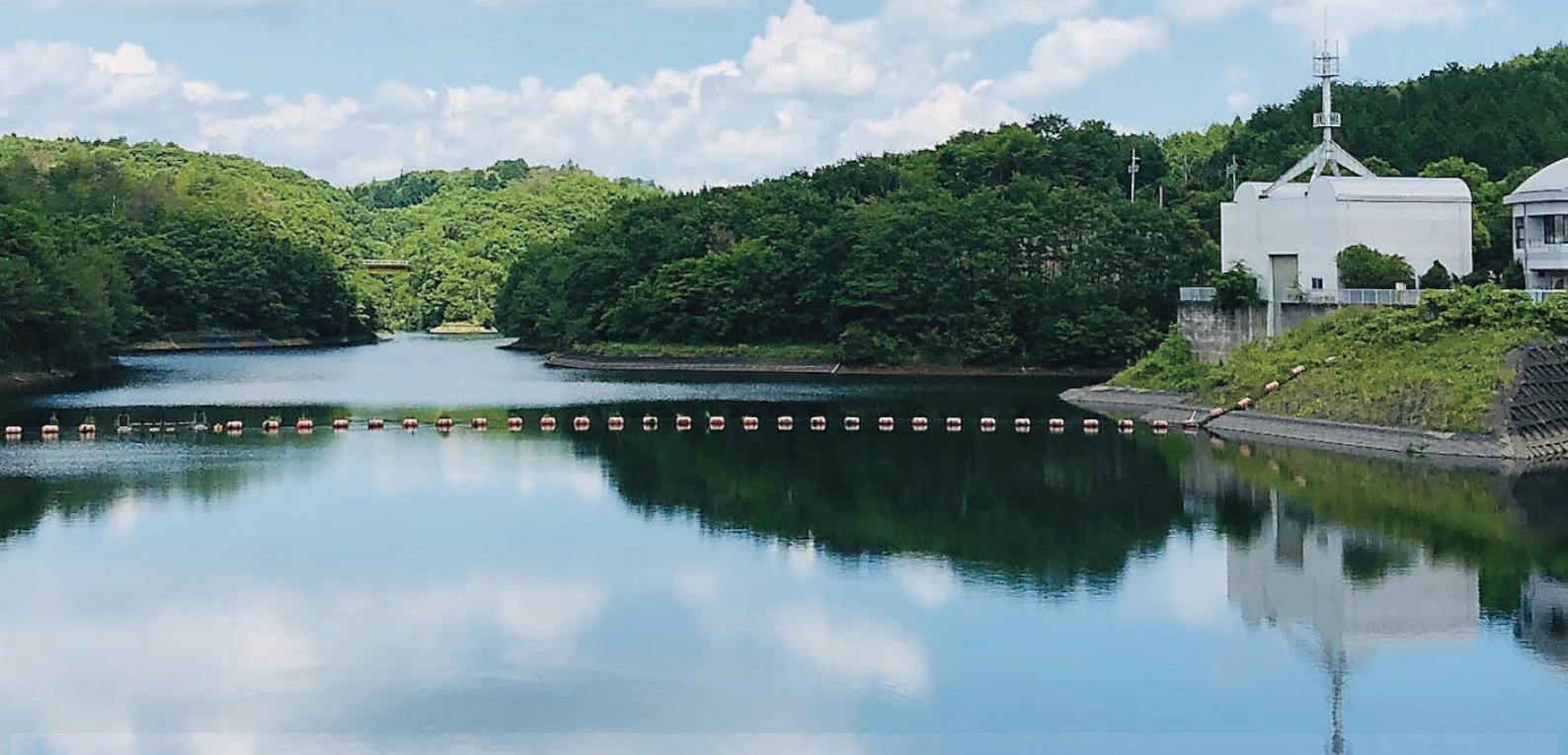
青空が映る飯田ダムの風景