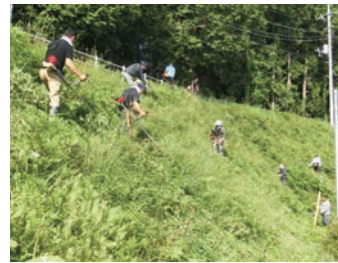
広大な急斜面での奉仕作業 (みなみ学園)

や管理職による作業のほか、PTAによる奉仕作業が年2回程度行われている。法面等の危険な場所の除草作業は、学校からの要望があった中から優先順位を決めて予算措置をしている。