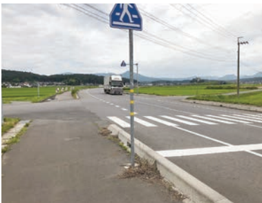
全線開通により交通量が急増。(来栖地内の通学路)

答 教育次長 全線開通に伴う新たな点検は開通後の交通の状況等を踏まえ、関係機関と安全対策の強化を図る。