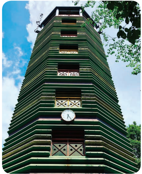
高さ 23 m の展望塔