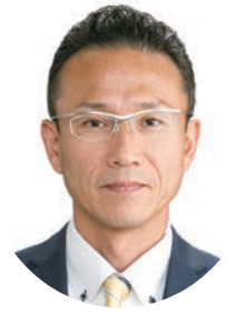
志貴 かし 議員 あみ 見 貴 志 安 見 貴 志