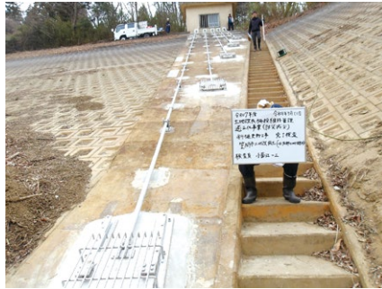
⑦【友部小原地区】斜樋更新工事