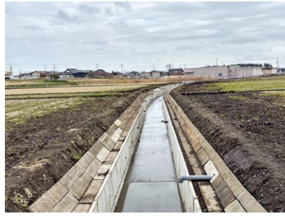
④【友部中央地区】排水路工事