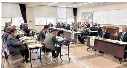
第1回 通常総代会の様子