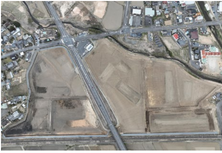
③【石井来栖稲田地区】荒整地工事