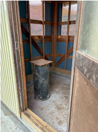
⑥【安居地区 吉沼池】さく井工事