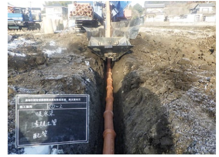
⑤【南友部大田町地区】暗渠排水工事