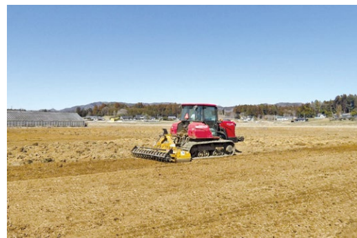
②【笠間大淵地区】畑整地工事