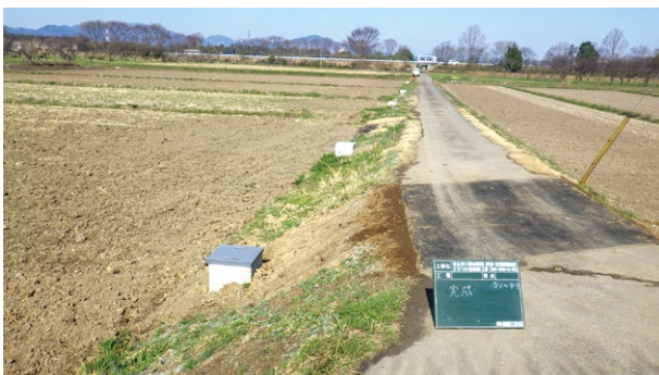
①【押辺・安居地区 吉沼池地区】パイプライン工事