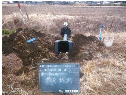
⑨【茨戸地区】田んぼダム施工中