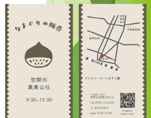
生栗販売促進カードの作成