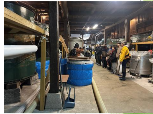
酒蔵見学ツアーの様子