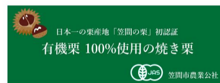
有機JAS認証看板イメージ図