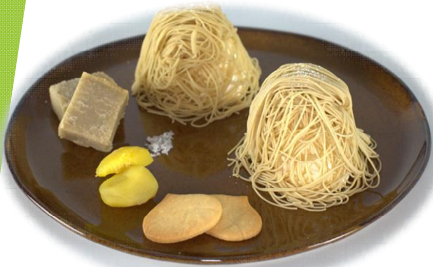
新商品のピアチェーレ