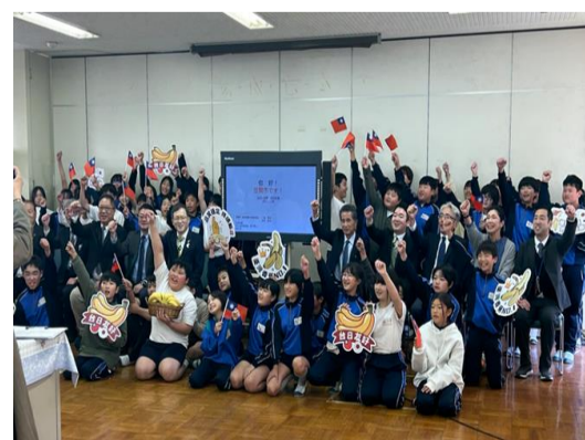
交流給食でのふれあい (笠間市)