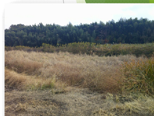
解約により荒廃した農地（笠間市内）