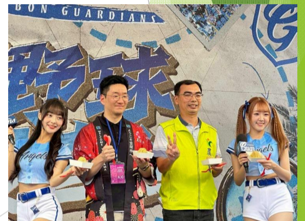
笠間の栗 モンブラン野球場PRイベント