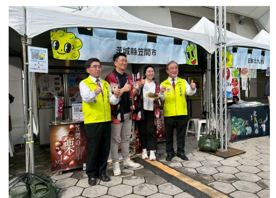
日台フルーツまつりPR