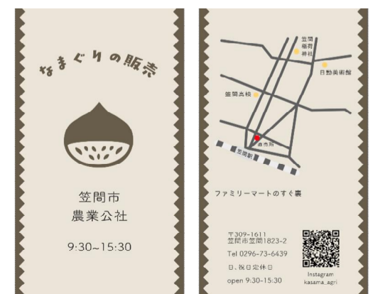
生栗販売促進カードの作成