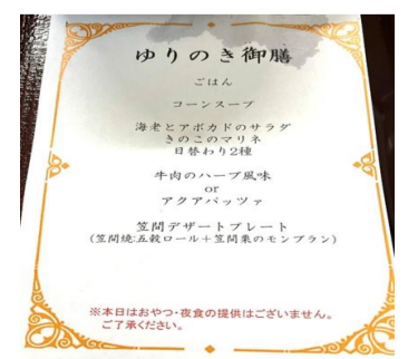
出産祝い御膳 (県立中央病院)