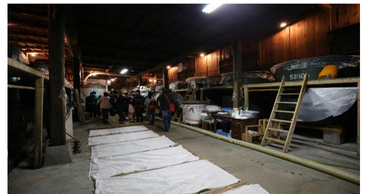
各イベントの様子