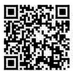
クーリングシェルター