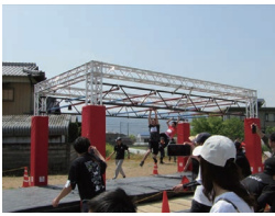
オブスタクルスポーツ