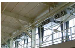
屋内運動場空調整備事業