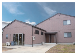
移住体験施設「かさちよHOUSE」