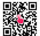
補助金について 詳しくはこちら