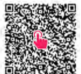
補助金申請はこちら (電子申請)

※結婚相談所などは、(一社) いばらき出会いサポートセンターまたは、市内に営業所を有している結婚相談所もしくはIMS認証を取得しているマッチングアプリとなります。