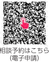
相談予約はこちら (電子申請)

申込方法 電子申請 (推奨)・電話でお申し込みください。 ※電話で予約する場合は、次の事項などをお伝えください。 氏名・連絡先・希望枠 (第1・2希望)・お住まいの地区・相談概要 など