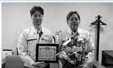
◀ イチカワ株式会社岩間工場