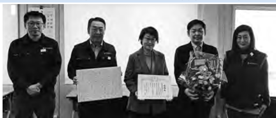
▲ 株式会社三栄製作所 茨城工場