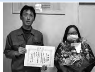
◀ 日新シャーリング株式会社 茨城工場