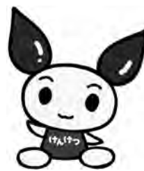
献血キャラクター けんけつちゃん