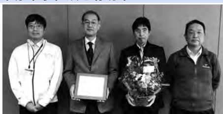
◀ 茨城県農業総合センター