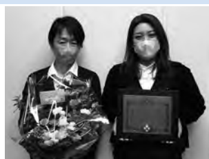
◀ 泰榮電器株式会社