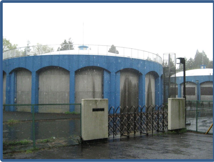
箱田配水池 【P C造 2,500m 3 ×2基】