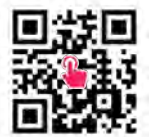
どうぶつ基金 ホームページ