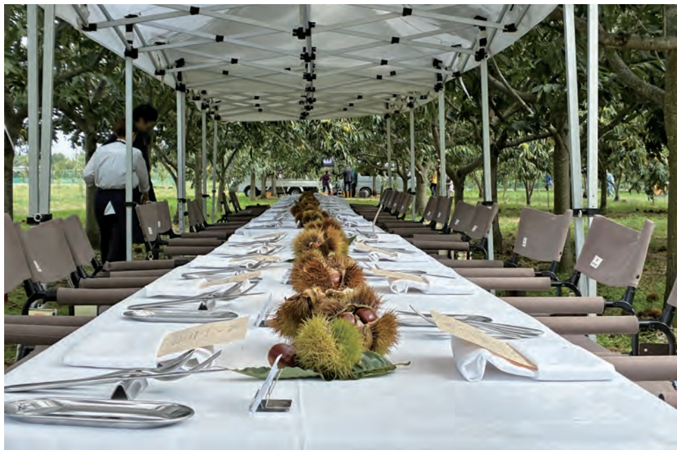
栗畑に特設されたレストラン