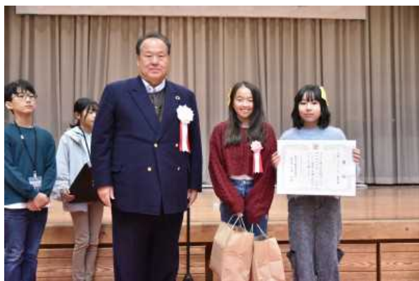
【奨励賞】授与:菊地こみを考える会会長