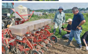
茨城大学小松崎先生と小原地区の農事組合法人「おぼらの里」の皆さんにご協力いただき、不耕起播種機での大豆播種を行いました！