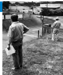
エコフロンティアかさま入口