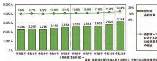
市の認知症高齢者の推移と将来推計

市では、高齢者福祉計画・介護保険事業計画(第9期)を策定し、基本目標に「認知症施策の推進」をかけた、5つの施策を柱とした取り組みを行っています。