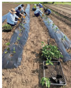
◀「みんなで農活 Day」笠間市社協の皆さんにもお越しいただきまして！みんなが植えました！