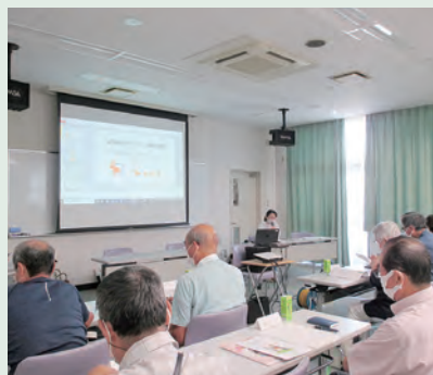
認知症サポーター養成講座