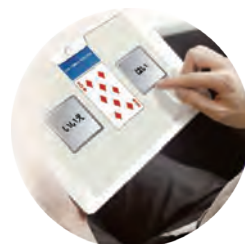
脳の健康チェック

※詳しくは、広報かさまお知らせ版(9月5日号)または市ホームページなどでお知らせします。