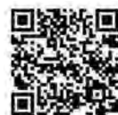
大人の予防接種について