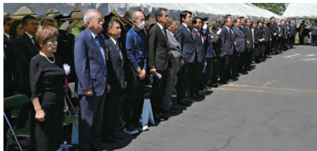
黙とうや献花などが行われました

山口市長は「尊い犠牲のもとに平和が成り立っている。この式典を後世に伝えなければならない」と呼びかけました。