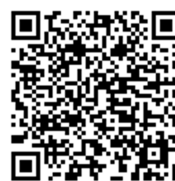
Web 予約の登録について