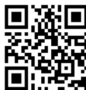
健診 Web 予約サービス