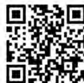
個人住民税について

なお、市民の皆さんに早期に給付をお届けする観点から、所得税の調整給付額は、令和5年分の課税状況に基づき算定されます。令和6年分の所得税額が確定した後、令和5年分と比較して所得に変動があるなどの一定の事情によって、当初の給付額に不足があることが判明した場合は、追加で給付されます。