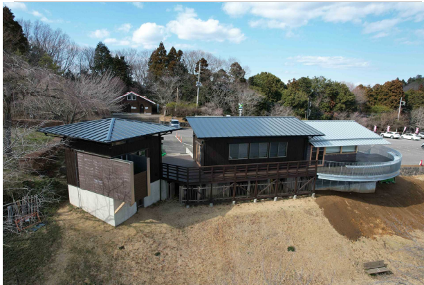
あたごフォレストハウス全景

あたご天狗の森公園は、子どもも大人も自然を満喫しながらリフレッシュできる場として、飲食・多目的スペース、シャワー付きの更衣室、眺望を活かした展望デッキ、斜面の高低差を利用した公園遊具などを新たに整備し、リニューアルオープンします。