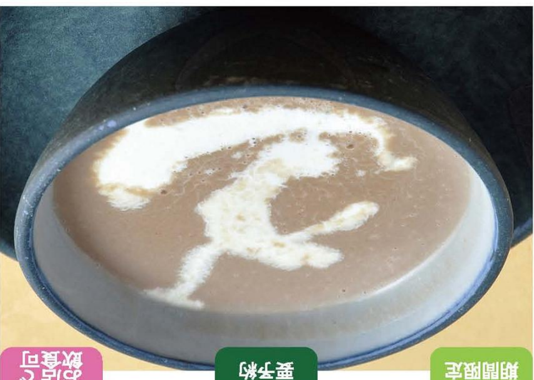
期間限定 産子約 お店で 飲食可

モン・ラパンの「笠間栗のスーパ」 小澤栗園の栗をていねいに選別して仕上げたスーパです。ふくよかな栗の風味をご堪能ください。*販売時期 10月～1月頃まで *モン・ラパン 11:30～14:30 17:30～20:00 *モン・ラパン/火曜日・第1月曜日 A-2 MAP 700円