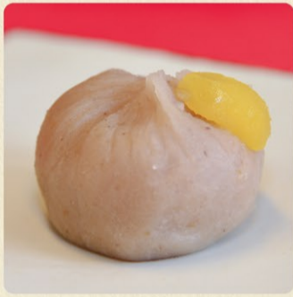
和モンブラン 300円 期間限定(9月下旬~)