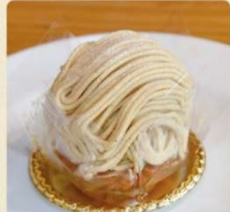
笠間の和栗モンブラン 600円 通年販売

サクサクタルト・甘さ控えめの生クリーム・和栗クリームがたっぷりの当主人気のモンブラン。