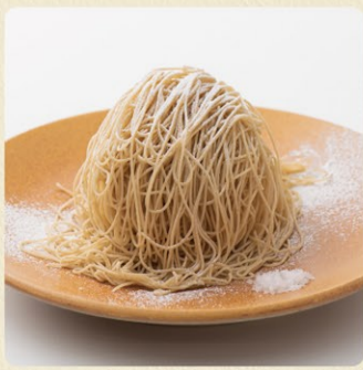
楽栗 filo(フィーロ) 820円 通年販売

栗の風味がお口中にふわっと広がるのは、フィーロ(糸)のように絞っているから。添えたシールソルトで甘さに強弱がつけられます。※10月、11月限定で蒸し栗をトッピング。