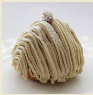
笠間地栗のモンブラン 735円 通年販売

笠間和栗の風味を生かしたこだわりのマロンクリームと土台のパイ生地が決め手の大人気商品。