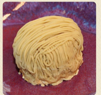
笑っちゃうほど美味しいモンブラン 864円 通年販売

本当に美味しいものを食べた時、人は笑ってしまうものです。その名に恥じぬ商品を作りたいのです。