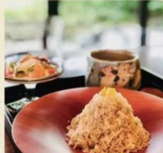
愛宕のこぼれモンブランとお飲み物 2,200円 通年販売

栗の栽培を奨励した元村長の家屋お座敷にて頂く、和栗の繊細な薫りを生かし閉じ込めないシェフ拘りの絞らないスタイルのモンブランです。 ※テイクアウトのモンブラン(950円)もございます。