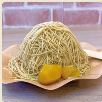
笠間のしぼりたて細糸モンブラン 1,400円 通年販売

極細に絞った栗をふわりと盛り、滑らかなクリームと組み合わせる、風味豊かな至高の逸品。