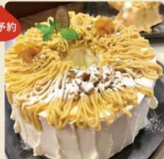
あたごブラン 3,200円[箱代込み] 期間限定(9月中旬~11月)

笠間市の栗と生クリームを贅沢に使用したシフォンケーキモンブランのホールケーキ(18cm)です。 ※2日前までのご予約をお願いします。