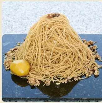
プレミアムモンブラン コーヒー付セット 1,800円* 通年販売

賞味期限5分。笠間産の栗を100%使用した究極のモンブランです!直径1mmの繊細な栗のペーストが折り重ねられ、栗の香りが口いっぱい広がります。*別途入場料300円/人がかかります。