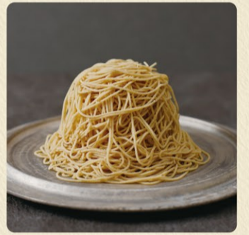
笠間栗のモンブラン 1,650円 通年販売

笠間の栗をふんだんに使った究極のモンブラン。注文が入ってから絞るので栗の風味を存分に堪能できます。