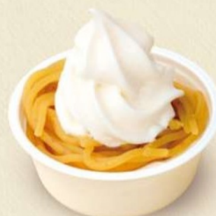
いわまのもんぶらんソフト 440円 通年(繁忙期は休業あり)

岩間の栗の濃厚なモンブランクリームと優しいソフトクリームがベストマッチなスイーツです。