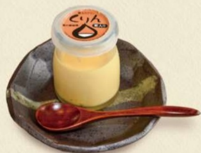
くりん 302円 通年販売

甘露煮にした笠間の栗・茨城の奥久慈卵と生クリームの比率を多くしたコクのあるぶりんです。