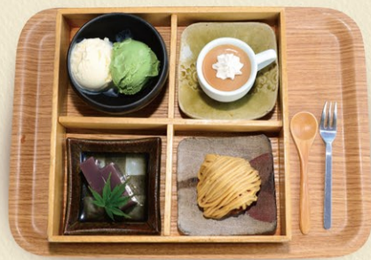
ドルチェ“栗ざんまい” 1,200円 通年販売

モンブラン、栗の和菓子、栗のジェラート、日替わりスイーツ、4種がお重に入ったセットです。