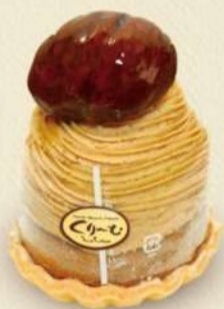
笠間のモンブラン 864円 通年販売

サクサクのタルトの上にアーモンドのロールケーキ、カスタード、生クリーム、和栗のペースト、笠間産大粒渋皮栗を乗せた贅沢な逸品です。