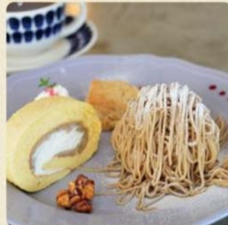
栗スイーツプレート 1,800円 期間限定(9月中旬~11月頃)

サクサクのメレンゲにモンブランクリームをたっぷり。デザートプレート仕立てどうぞ。