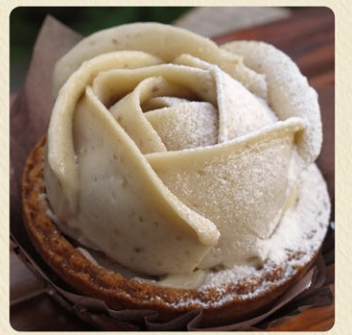
いばらきマロンタルト 550円 期間限定(9月下旬~12月10日頃)

日本一の栗の産地、笠間の新鮮な栗を使い、茨城の県花であるバラの花の形に仕上げました。