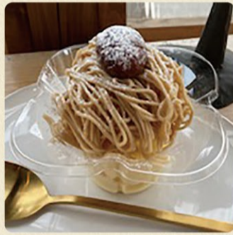
栗の宿(くりのやど) 980円 期間限定(9月~12月)

自家生産の栗と特濃豆乳で作ったモンブランクリームを自家製豆乳ソフトクリームにたっぷりとかけ、自家製栗の渋皮煮を乗せました。