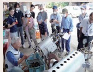
笠間の焼き栗講座