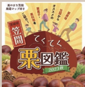
昨年のパンフレット

笠間の栗を使用した菓子や料理など、市内の栗商品全般を紹介するパンフレット。栗商品の購入金額に応じてスタンプが貯まるスタンプラリーを実施します。