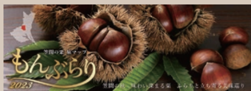
昨年のパンフレット

笠間の栗を使用したモンブランだけを紹介するパンフレット。掲載商品の購入者を対象としたデジタルスタンプラリーを実施します。