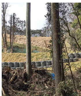
市内メガソーラー周辺土砂崩れ跡。地形と方向、時系列でみて、発電に伴う森林伐採と無関係とは思えないが…。

間市の環境理想像から、乖離し続けているのが現実だ。理想的な状態に戻す代替手段は。 答 環境推進部長 関係法令、国県のガイドラインに基づく適切な指導により豊かな自然を守る。