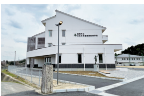
みなみ学園義務教育学校

答 教育長 適正規模・適正配置の計画についての基本的な考え方や方向性を進めていく上で、義務教育学校化は重要な選択肢の一つになると考えている。