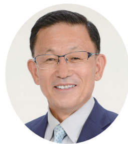
はた おか よう じ 畑 岡 洋 二 政 研 会