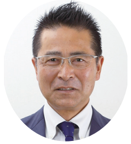
ゆき かつ おけ うち 内 桶 克 之 か さ ま 未 来