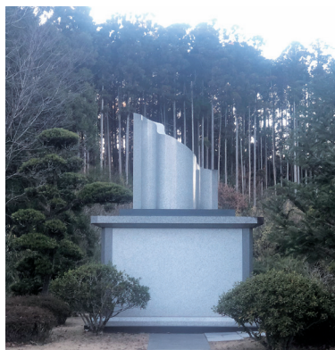
やすらぎの森・納骨堂

答 福祉事務所長 市町村長が葬祭を行った遺骨の取扱いは法令上規定がなく、茨城県の取扱い手引きで、原則的には市町村長が保管すると示される。引取り手がいない場合、判明しない遺骨は、笠間広域斎場の納骨堂に安置し、引取り手が判明すれば、手続を取り御遺族の手に渡す。安置された御遺骨は数年間保管の後、最終埋葬地で法要の後、永代供養される。