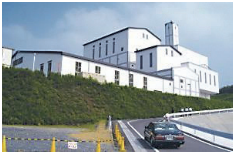
「エコフロンティアかさま」

答 環境推進部長 「方針決定前に話がなかった」というような話については、対策協議会から聞いている。これまで運営されてきた経緯を踏まえると、4者協定に基づき地元住民の理解を得ながら、県及び事業団から