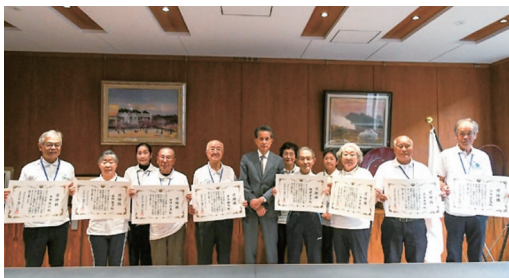
シルバーリハビリ体操指導士の皆さんが県知事から表彰を受けました。

問 介護予防対策は。 答 福祉事務所長 認知症予防、転倒予防、運動機能向上など、テーマ別の介護予防教室を