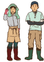
農業者の数を減らしてはいけない。