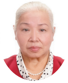
はやしだ みよこ 林田美代子 日本共産党