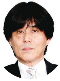
お 雄 俊 松 まつしお い 石 松 俊 市 政 会