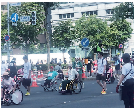
はまなす車いすマラソン 2023・ショートレース (札幌市)

会誘致で地域外の来訪者獲得、市内経済活動の活性化、台湾とスポーツ国際交流で市内小学生のグローバル感覚の醸成やインバウンドの獲得、障害者スポーツ啓発等、各種団体と連携しスポーツの力を最大限に活用してスポーツを通じた持続的なまちづくりに取り組む。