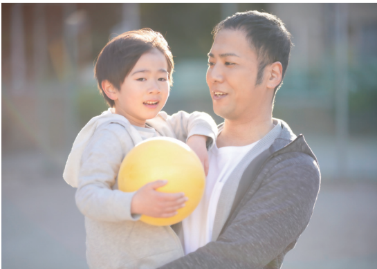
子どもが健やかに育つ希望あるまちに（写真はイメージです）

答 保健福祉部長 医療福祉費支給制度の市単独事業として中学生・高校生の外来一部負担金に対する助成の継続、全受給者区分における所得制限を撤廃したことで受給対象者を拡充した。県内で所得制限を妊産婦、子ども、独り親、重度心身障害者の全受給者区分で撤廃しているのは本市を含め3市のみ。自己負担金助成事業を改めて実施する考えはない。