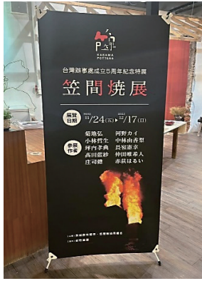
鶯歌での笠間焼展

答 間焼の認知度向上、販売促進を図るため、笠間焼協同組合と連携し、台湾最大の陶磁器の街、鶯歌で販売店の協力の下、10月に新北市陶磁組合主催の産地開放日へ参加。ほか5周年記念笠間焼展のイベント開催。各イベントには笠間焼作家も参加、直接、笠間焼の説明やワークショップで多くの来場者に笠間焼を身近に感じてもらった。