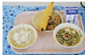
台湾産バナナが提供された給食

答 産業経済部長 バナナの輸入に関しては、教育委員会事務局の詳しい給食推進室、栗の輸出に関しては、農政課の栗ブランド戦略室が事務を行っている。