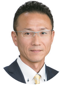
志貴 未来 あみ たか し 安見 貴志 か さ ま 未 来