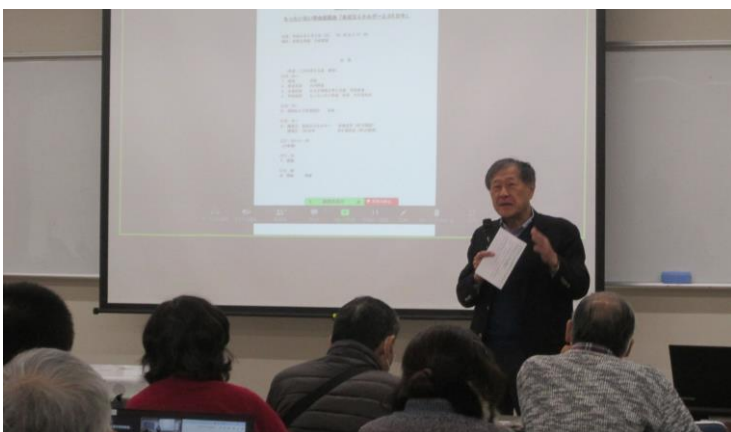
再生エネルギーも有限ではないか？