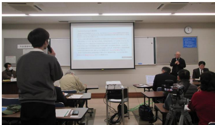
活発な質疑応答が予定時間を過ぎても続く