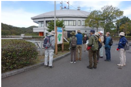
ダム管理棟の前で地図を見る