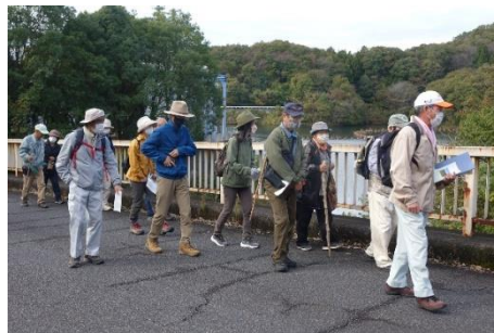
ダム湖を見ながら歩いています