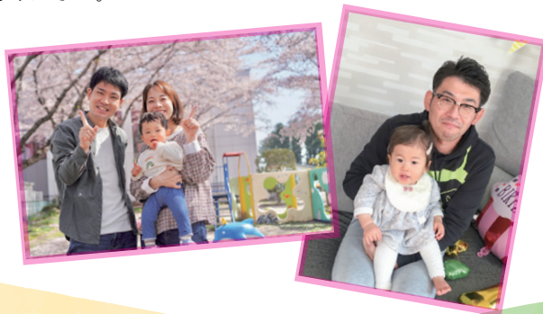
これまでの掲載例

申込締切は毎月20日です。原則として、申込月の翌々月発行の広報紙に掲載します。申込方法などの詳細は下の二次元コードからご確認ください。