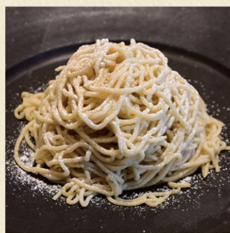
笠間栗のモンブラン 1,650円~* 期間限定(9月中旬)

笠間和栗の風味と美味しさを活かすため、作り立てを提供いたします。 ※ドリンクとのセット料金。どのドリンクを選ぶかで金額が変わります。