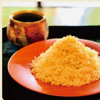
こぼれモンブランとお飲み物セット 2,200円 通年販売

バリッシュラン3つ星レストランや、東京マカオの高級ホテルにて長年シェフパティシエを務めたシェフ渾身のオリジナル。絞らずふんわりと削ることで栗が十分に薫る究極のモンブランをぜひご堪能ください。 ※テイクアウトのモンブラン(950円)もございます。