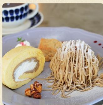
栗スイーツプレート 2,000円 期間限定(9月~11月中旬頃)

サクサクのメレンゲにモンブランクリームをたっぷり。デザートプレート仕立てどうぞ。