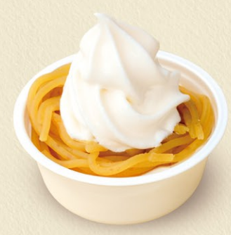
いわまのもんぶらんソフト 500円 通年販売

いわまの栗の濃厚なモンブランクリームと優しいソフトクリームがベストマッチなスイーツです。