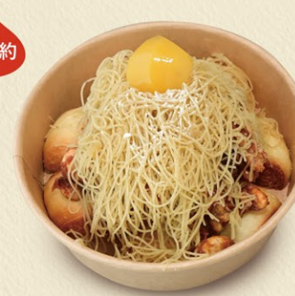
デニッシュモンブラン 1,000円 期間限定(10月初旬~栗がなくなり次第終了*)

サクサクパンに細糸しぼりモンブランをかけた風味豊かな出来たてモンブランです。 ※販売日が不定期であるため、電話にてあらかじめお問い合わせください。