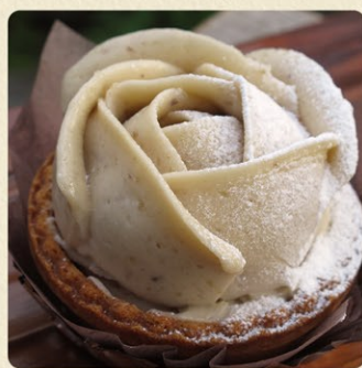
いばらきマロンタルト 600円 期間限定(9月中旬~12月中旬)

笠間の栗の渋皮煮を中心に、マロンペーストでバラの花をつくり、栗ケーキ入タルトの上にのせた一品です。