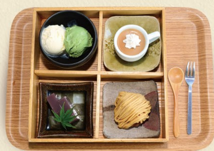
ドルチェ「栗ざんまい」 1,200円 通年販売

モンブラン、栗の和菓子、栗のジェラート、日替わりスイーツ、4種がお重に入ったセットです。