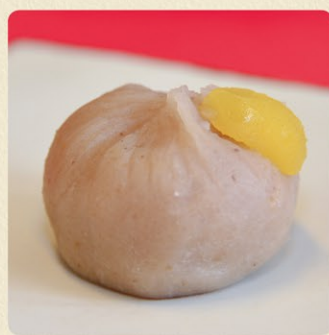
和モンブラン 300円 期間限定(9月下旬~)