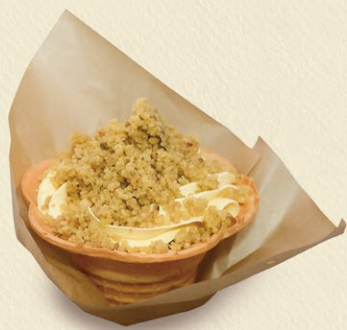
プチ和栗サンデー 540円 期間限定(4月~12月中旬)

焼栗アイスにマロンホイップをのせて、栗そのままを味わえる和栗フレックをトッピングしています。