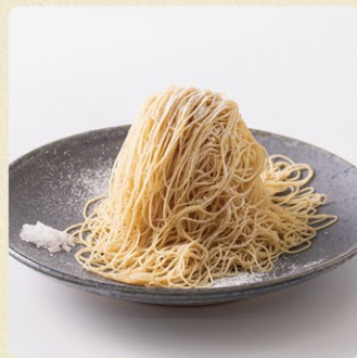
栗栗filo(フィーロ) 880円 通年販売

栗の風味が口の中にふわっと広がるのは、フィーロ(糸)のように絞っているから。添えたシートで甘さに強弱がつけられます。