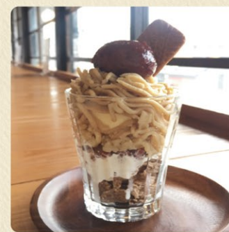
栗パフェ 1,430円 期間限定(9月中旬~11月末)

3日間かけて作る自家製の渋皮煮と栗のペースト、バニラアイスの3つの調和をおたのしみ下さい。