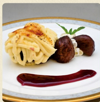
栗ームチーズの焼きモンブラン 500円 期間限定(9月16日~11月30日)

洋食屋SUNオリジナル栗ームチーズの焼きモンブラン。店内でお食事をして下さった方限定。1日15食♪