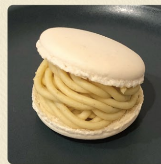
笠間の栗モンブランマカロン 490円 期間限定(9月~11月)

モンブランクリームをサンドしてトゥンカロン風に仕上げました。その他しぼりたてモンブラン、栗シェイクも販売しています。