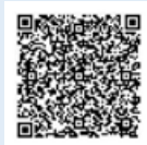
受診券の電子申請は こちらから