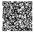
採血基準や献血の流れ

血液は長期保存ができず人工的に造ることもできないため、1年を通して継続的な献血へのご協力を願っています。また、献血者の健康を守るため、1人あたりの年間献血回数・献血量には上限があります。そのため、安定的に血液製剤を届けるためには、日々多くの方の協力が欠かせません。少子化により献血可能な人口が減少している中、特に10代～30代の献血者が減少しています。若い世代の方々のご理解とご協力が不可欠です。この機会に献血に行ってみませんか。