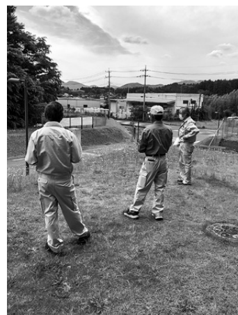
エコフロンティアかさま入口