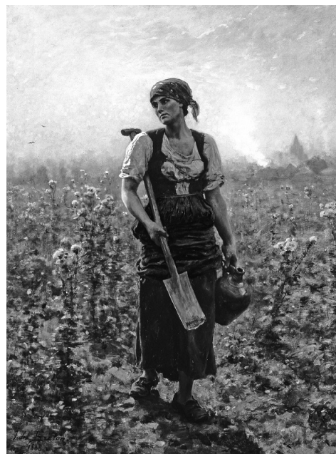
ジュール・ブルトン 《朝》 1888年 山梨県立美術館蔵