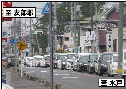
県道友部内原線の交通混雑状況(朝)