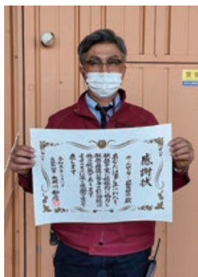
ホームセンター山新友部店の 白土副店長