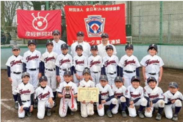
準優勝した友部リトルリーグの皆さん