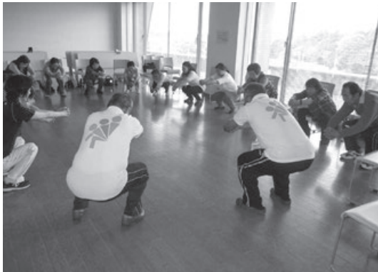
シルバーリハビリ体操の様子