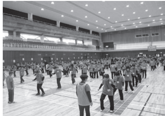
スクエアステップ教室の様子