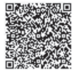
いばらき電子申請・届出サービス