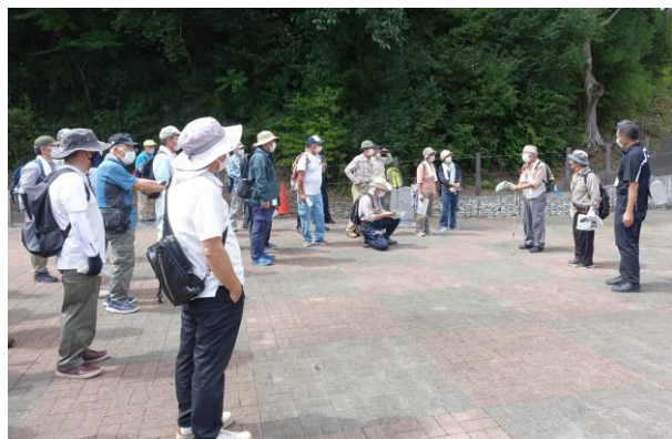
無事帰着 おつかれさまでした