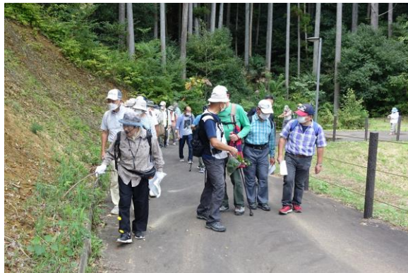
ここにセンブリがあります