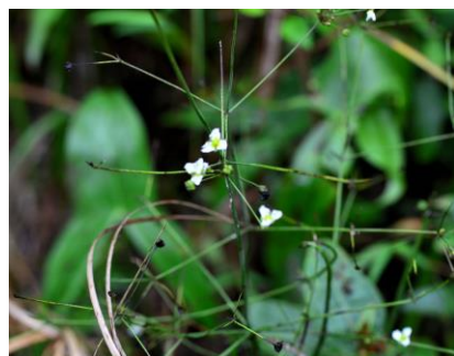
トウゴクヘラオモダカ