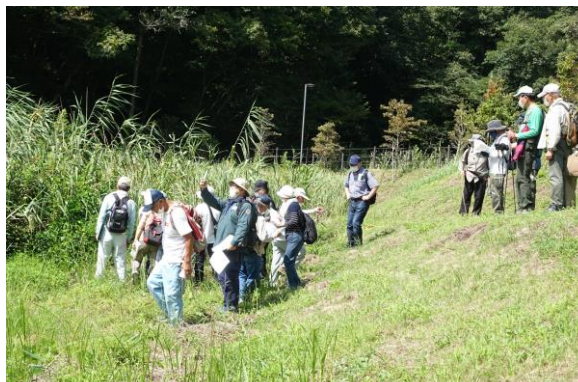
湿地の植物についての解説