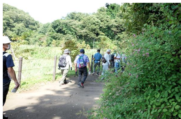
ヤマハギをながめながら