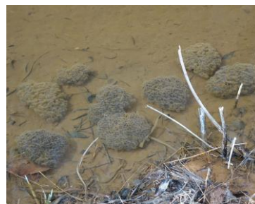
ニホンアカガエルの卵塊