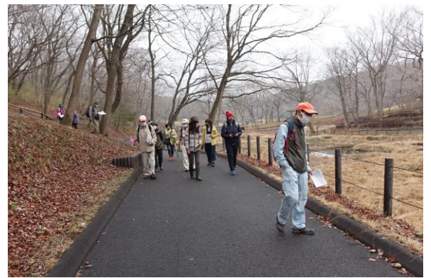
新池畔の散策/北山公園