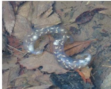
トウキョウサンショウウオ 卵のう