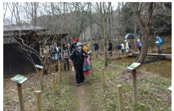
天神の里で観察開始