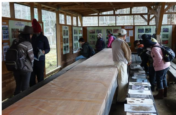
天神の里休憩施設で地衣類の紹介