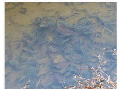
ヒキガエルの卵塊