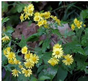
アワコガネギク 花