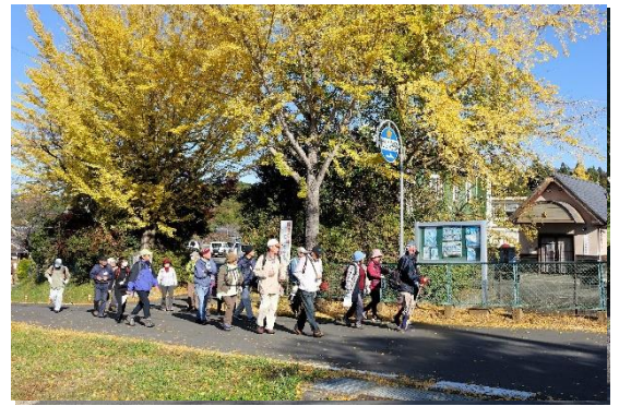
イチョウの黄葉を見ながら出発