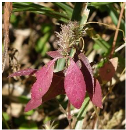
キツネノマゴ 紅葉