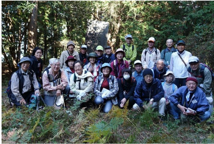
参加された方々(朝房山の山頂で)