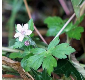
ゲンノショウコ 花