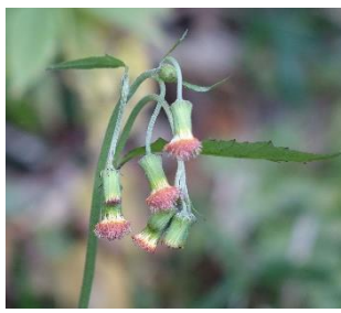
ベニバナボロギク 花