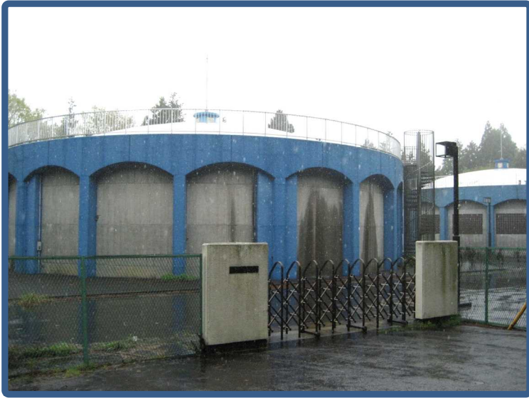
箱田配水池 【PC造 2,500m 3 ×2基】