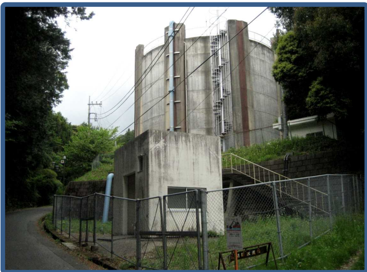
愛宕配水池 【PC造 2,000m 3 】