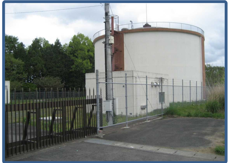
南友部高区配水池 【PC造 3,000m 3 】