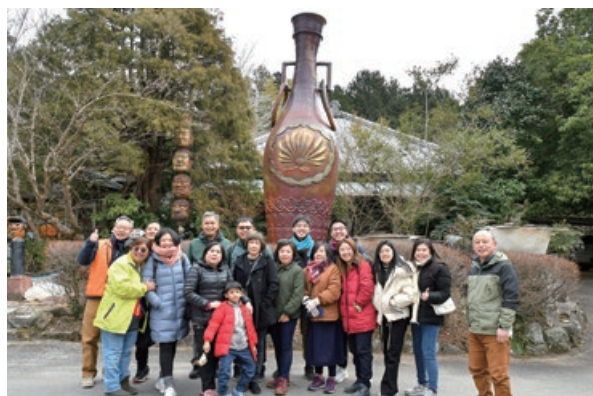
マレーシアの皆さん、ぜひまた笠間にお越しください

参加者は「古民家に泊まって、囲炉裏を囲む貴重な体験ができた」「とても楽しかった」と話してくれました。