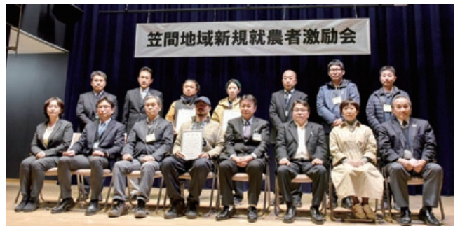
「地域の中心的な農業者として活躍してください」とエールが送られました

激励会では、令和3年度に笠間市・城里町で新規就農した皆さんに、笠間地域就農支援協議会から激励状と激励のことがばが贈られました。