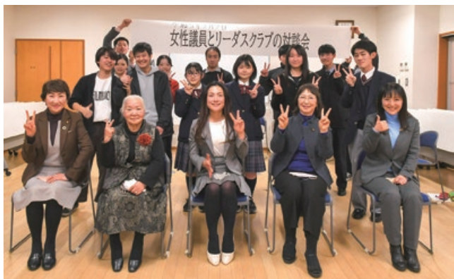
対談会の最後はみんなで記念撮影