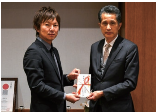
(左) 笠間遊技場組合 東原組合長