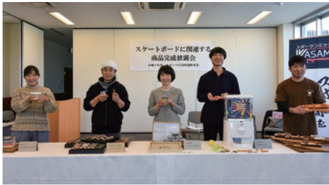
商品開発プロジェクトに参加した皆さん

1月20日には、商品のプロモーションや作品の披露会を実施。笠間焼のオブジェや箸置き、スケートボードをかたどったクッキーやパンなど、皆さんの創作力が際立った商品が発表されました。