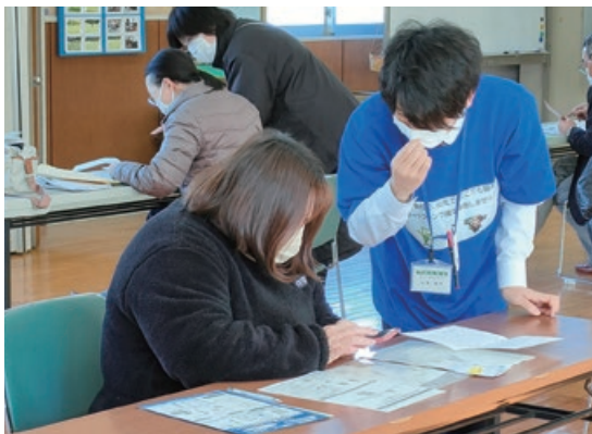
確定申告会の様子

参加した皆さんには、翌年から自宅で申告できるよう自分のスマホに自身の情報を入力していただきました。