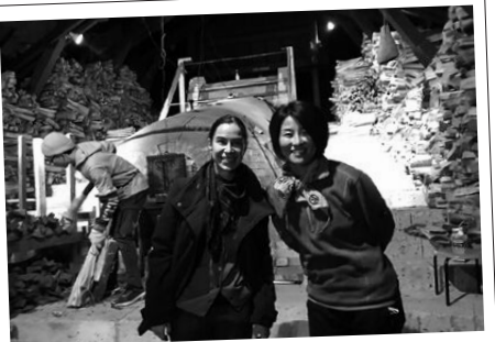
まへ 登り窯の前で ともだち (友達になった陶芸大学の学生さんと)