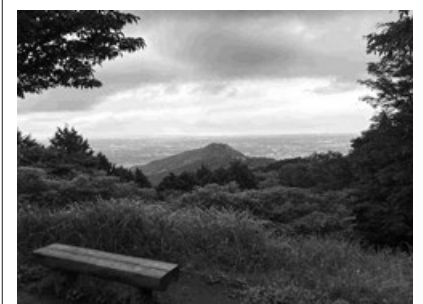
南山広場からの風景

9年前、笠間市に初めて来たとき愛宕山に登り、愛宕神社にあった天狗の 大面やお守りを見てはじめて天狗のことを知りました。