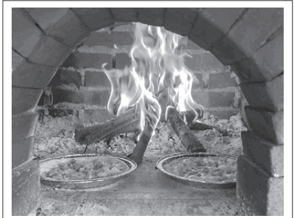
本物の窯で焼く栗ピザ