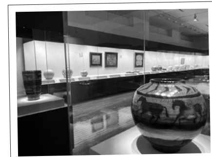
県陶芸美術館での人間国宝の企画展