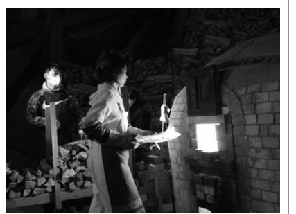
薪を窯に入れる陶芸大学の学生

笠間市に住み始めて、陶芸の魅力をを感じる展示会やイベントの情報が常に みみ はい すすこ きょうみ わ ひまつり いざひ はつがまち 耳に入ってきます。少しずつ興味が湧き、これまでに陶炎祭、彩初窯市、 とうえん 桃宴、オープンアトリエなどに行きました。