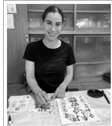
御朱印書きに挑戦

文 | ザグミョンノワ・ナターリア 問い合わせ | 笠間市秘書課 (内線225)