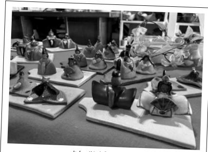
ねん せいとう さつえい 陶雛(2022年「製陶ふくだ」で撮影)

ぶん | ザグミョンノワ・ナターリア と あ ひまわり 問い合わせ | 笠間市秘書課 ないせん (内線225)