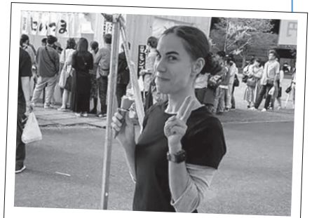
栗ソフトクリームは最高!

ぶん | ザグミョンノワ・ナターリア 問い合わせ | 笠間市秘書課 (内線225)