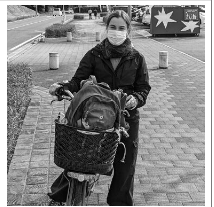
でんどうじてんしゃ きがる 電動自転車で気軽に店舗を巡りました