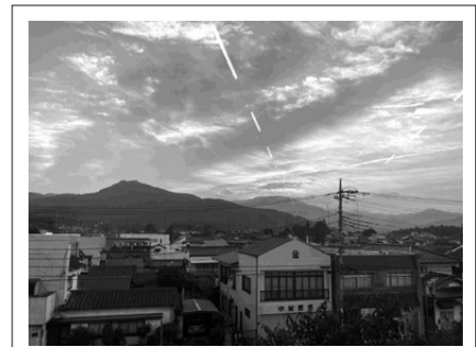
あたごさん ひぐ 愛宕山の日暮れ

また、市民の皆さんが、海外から笠間に来た人にも道案内ができるように、英語での観光地の名前などもお伝えしますので、ぜひ覚えてください!