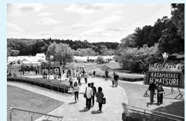
ことし 今年は4月29日~5月5日開催予定

「Pottery Festival」という単語をつけることで、焼き物のお祭りということが伝わりやすいです。