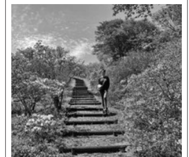
笠間つつじ公園のインスタ映え