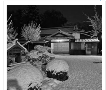
雪の降り積もる道場

職員だけでは分からない市の話題などを伝えるため、皆さんからの投稿を募集し、市の公式SNSでシェアする取り組み「笠間市民ニュース」。