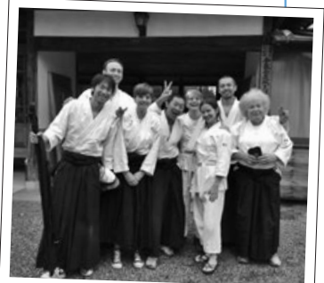
アメリカからの合気道仲間と