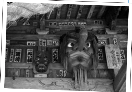
愛宕神社に飾ってある天狗の四面