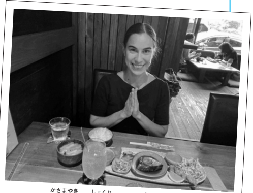
かさまやき しょくじ たの 笠間焼で食事をより楽しく!

文 | ザグミョンノワ・ナターリア 問い合わせ | 笠間市秘書課 (内線225)