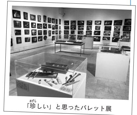
「珍しい」と思ったパレット展