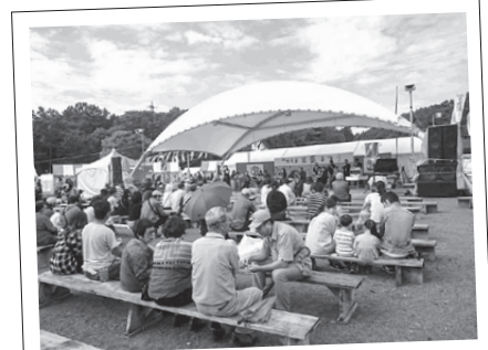
コンサートも楽しみました