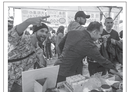
友だちも笠間の栗が好きになりました