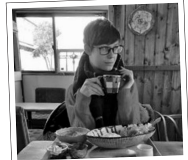
レトロなインテリアのカフェで 笠間焼でランチ

文 | ザグミョンノワ・ナターリア 問い合わせ | 笠間市秘書課 (内線225)