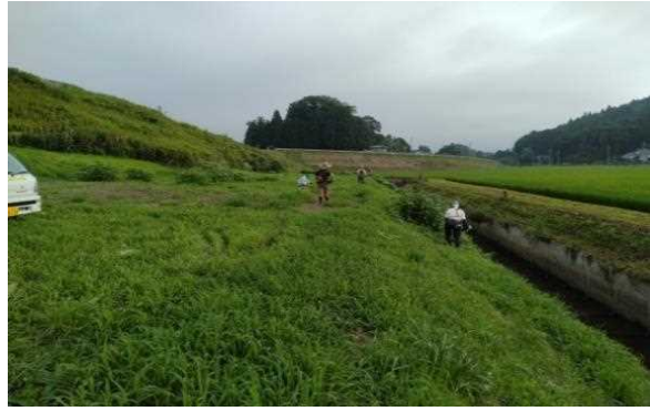
【時期】7月23日(土) 【内容】上流水路法面及びため池周辺草刈