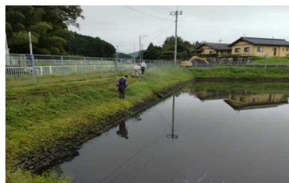
【時期】9月3日(土) 【内容】ため池周辺・水門下流の水路法面・遊休地の草刈及び付帯施設の保守管理。