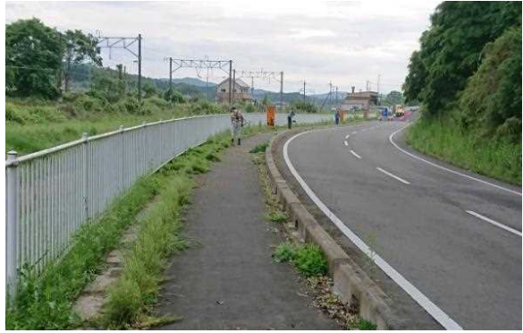
【時期】5月22日(日) 【内容】新市道ガードレール・歩道廻りの草刈