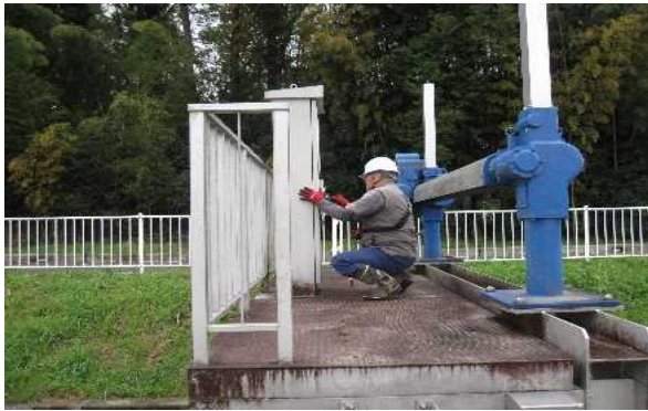
【時期】4月16日(土) 【内容】ため池廻り草刈及び機場設備点検・試運転