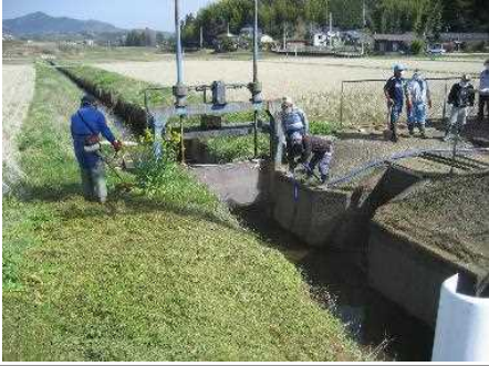
【時期】令和4年4月 【内容】ため池附帯施設の管理、清掃