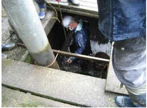
【時期】令和4年8月 【内容】ため池(第2機場)ポンプ受水槽の泥上げ