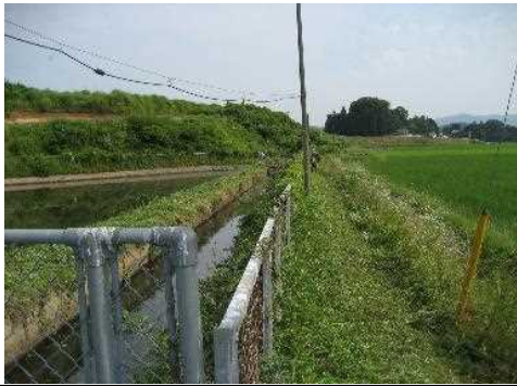
【時期】令和4年7月 【内容】ため池・水路・農道の草刈り