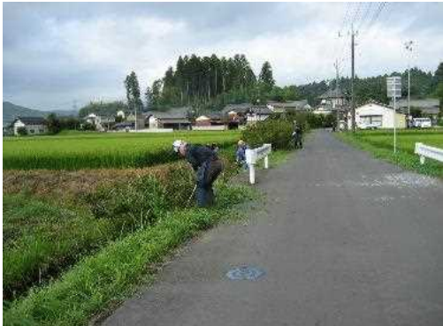
【時期】令和4年5月～9月 【内容】フラワーロード(市道)草刈り