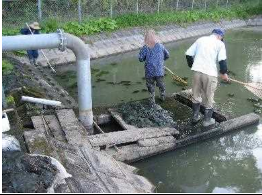
【時期】令和4年5月 【内容】ため池(第2機場)藻くず取り