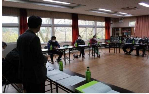
【時期】4月 【内容】農業者による検討会、及び施設の維持に関する計画策定