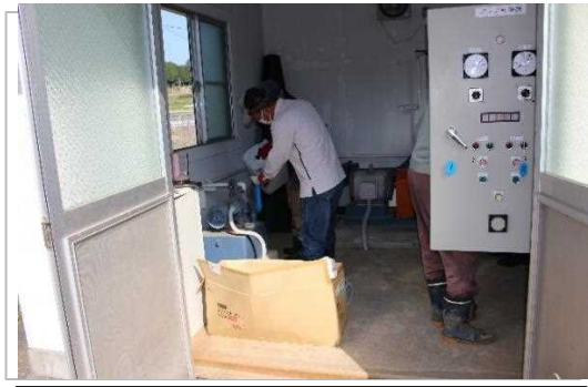
【時期】5月 【内容】ポンプ他機器類の点検