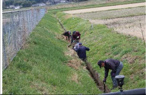
【時期】4月 【内容】水路の泥上げ