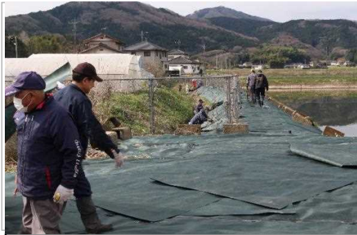
【時期】4月 【内容】第4エリアため池法面等へ防草シート敷設