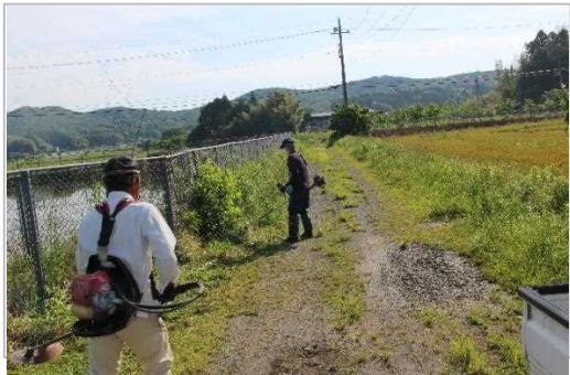
【時期】5月 【内容】ため池周辺及び水路法面の草刈り