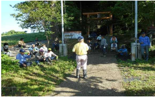
【時期】 4月 【内容】 道路、水路の維持管理計画を発表した。合わせて、本年度より実施する土地改良事業の説明を行った。