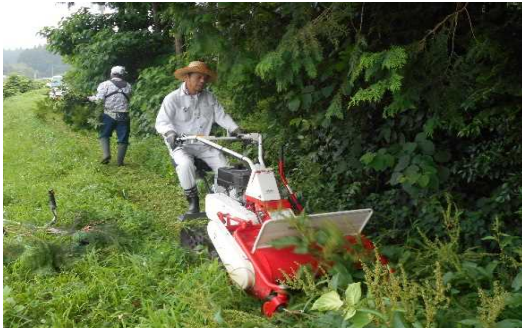
【時期】 5月、7月、8月 【内容】 乗用草刈り機による農道・水路の除草を、年3回行っている。