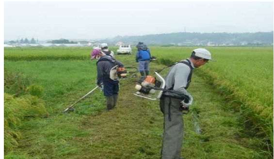
【時期】 5月、7月、8月 【内容】 人力により、耕作道路・水路周辺の除草を、年3回行っている。