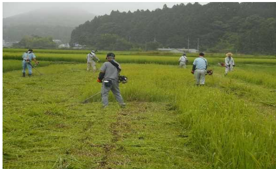
【時期】 5月、7月、8月 【内容】 農業者の高齢化、および軟弱地盤の影響で機械作業ができず、遊休農地となっている箇所がある。この管理として除草を年3回行っている。