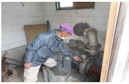
【時期】 4月 【内容】 代掻きに備えて、揚水ポンプの点検整備を行った。合わせて、用水路の泥浚いと草刈りを行った。