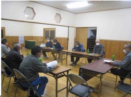
【時期】 4月24日 【内容】 総会 出席者 132名(うち委任状123名) 議案・報告等はすべて承認された。