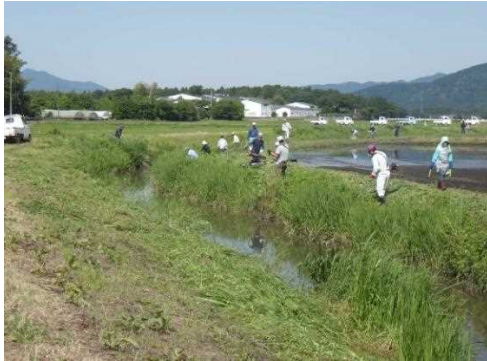
【時期】 5月29日・7月3日 【内容】 大排水路等の草刈り 参加者 5月 78名 7月 79名 大排水路、農道等の草刈