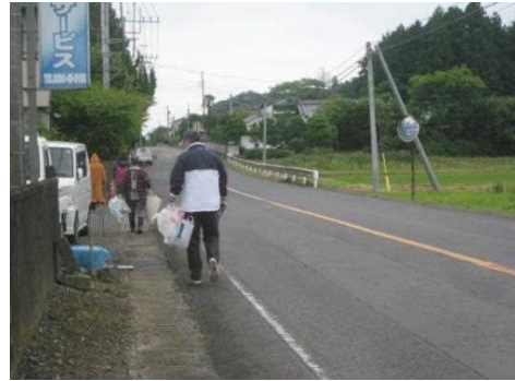
【時期】 6月5日 【内容】 定期的なごみ拾い 参加者 約70名 農道等の空き缶等のごみ拾い