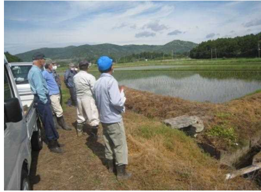
【時期】 5月16日 【内容】 施設の点検・機能診断等 参加者 7名 耕作状況確認、水路等の機能診断