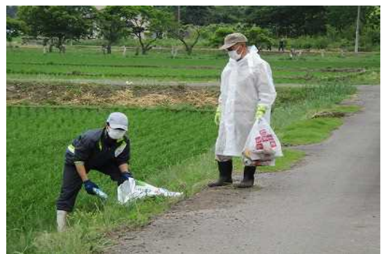
【時期】 6月5日 【内容】 地域内の清掃及び地域住民との交流活動の実施