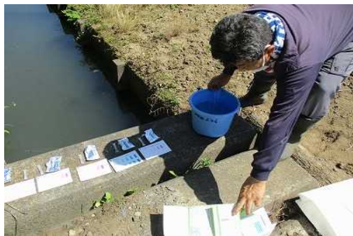
【時期】 6月26日 【内容】 水質調査を実施