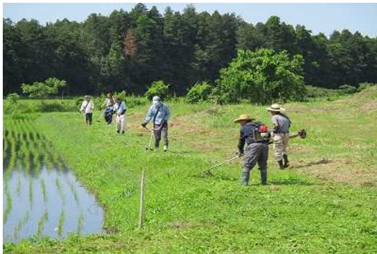
【時期】 5月29日 【内容】 農用地・水路・農道など 草刈りを実施