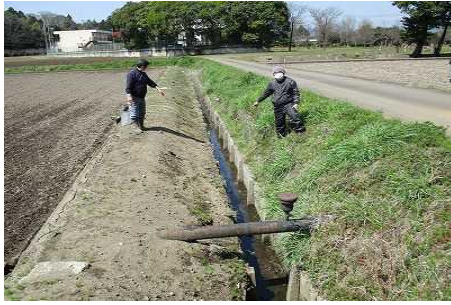
【時期】 4月10日 【内容】 水路・農道・ため池・農用地など施設の点検・機能診断の実施