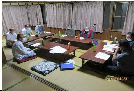
【時期】 4月23日 【内容】 年度活動計画の策定など役員会を実施した。