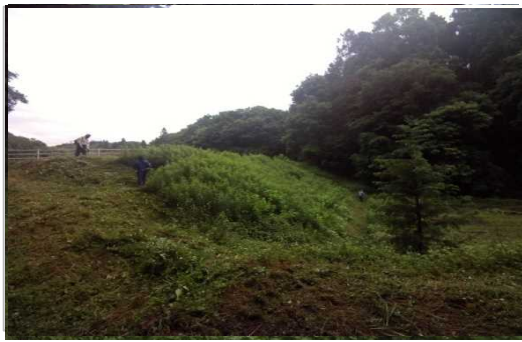
【時期】令和4年6月12日 【内容】ため池の草刈りを実施した。