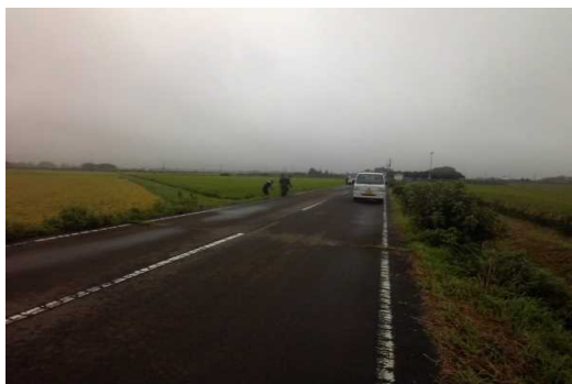
【時期】令和4年8月31日 【内容】施設等(農用地・水路・農道・ため池)の点検及び草刈り実施した。