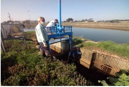
【時期】令和4年4月10日 【内容】施設等(農用地・ため池・機場・パイプライン・農道・水路)の点検及び機能診断を行った。