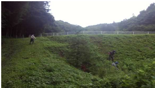
【時期】令和4年7月17日 【内容】ため池の草刈りを実施した。