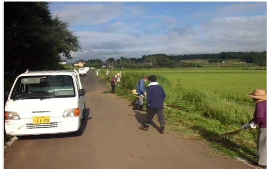
【時期】令和4年8月7日 【内容】環境整備による農用地・農道・植栽地の草刈りを実施した。