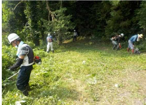
【時期】7月、9月 【内容】ため池、水路、農道、法面等の草刈り。 10月にも実施予定