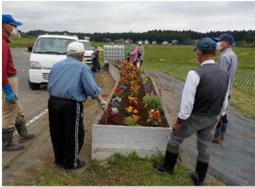
【時期】6月 【内容】花壇の植栽を実施(5ヶ所) 花の苗は前日に購入