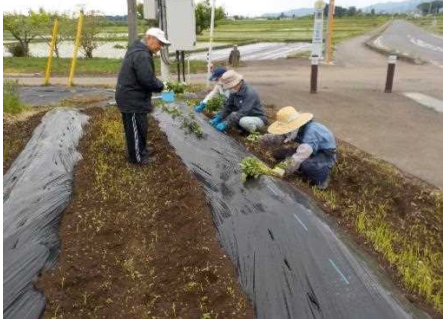
【時期】5月 【内容】さつま芋の植栽を実施