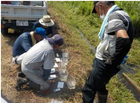
【時期】7月 【内容】水質調査(4ヶ所) 11月にも実施予定