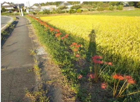
【時期】9月 【内容】 景観形成を目的として毎年3月に彼岸花の球根を道路沿いの法面に植えている。