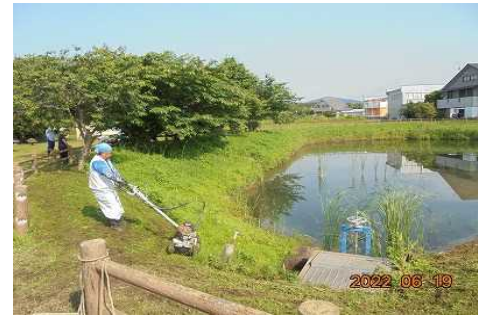
【時期】 6月19日 【内容】 ため池・水路・農道など草刈りを実施