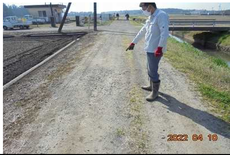
【時期】 4月11日 【内容】 水路・農道・ため池・農用地など施設の点検・機能診断の実施