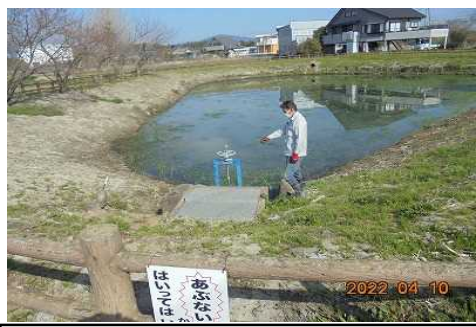
【時期】 4月11日 【内容】 水路・農道・ため池・農用地など施設の点検・機能診断の実施