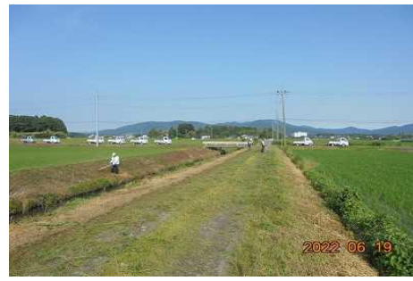
【時期】 6月19日 【内容】 ため池・水路・農道など草刈りを実施