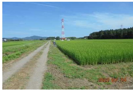
【時期】 7月24日 【内容】 農用地・農道の草刈りを実施