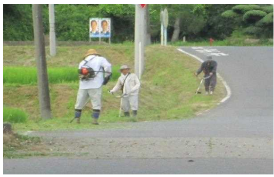
【時期】 7月 【内容】 道路及び水田畦畔の除草