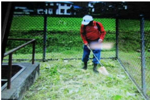
【時期】 8月 【内容】 機場まわりの除草剤散布による作業道路法面・水田の法面の除草