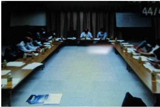
【時期】 6月 【内容】 年度内事業の協議