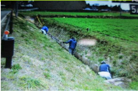
【時期】 4月 【内容】 機場への用水路の清掃・泥上げ