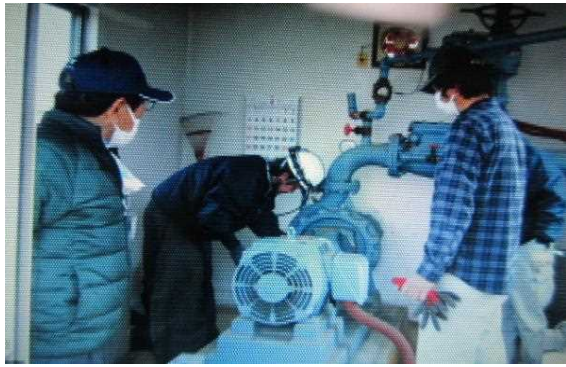
【時期】 4月 【内容】 機場ポンプ等のシーズン前点検