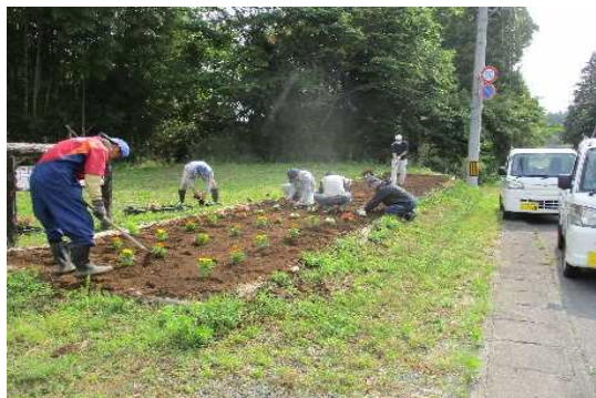
【時期】6月 【内容】 遊休農地を利用した花壇の植栽による環境美化活動を実施。