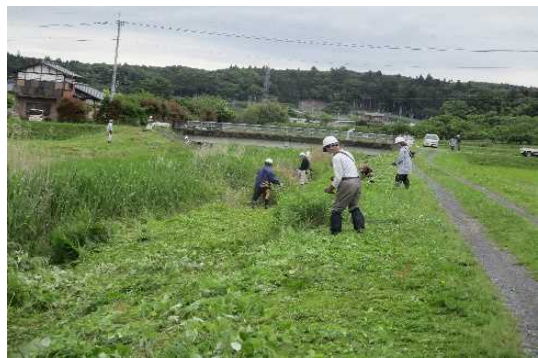
【時期】5月 【内容】 河川・水路・農用地法面等除草活動を実施した。