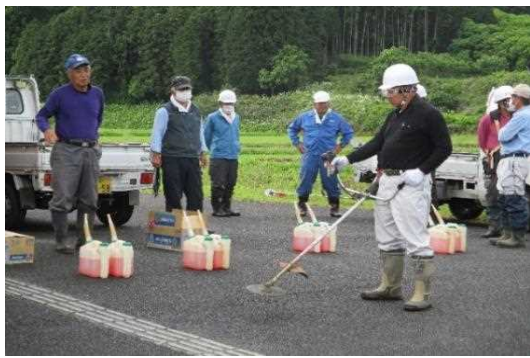
【時期】5月 【内容】 刈払い機による除草作業前に「機械の安全使用に関する研修」を実施した。