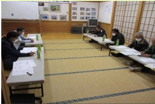
【時期】4月 【内容】 コロナ禍により書面による総会を開催。年間事業計画等審議し決定した。