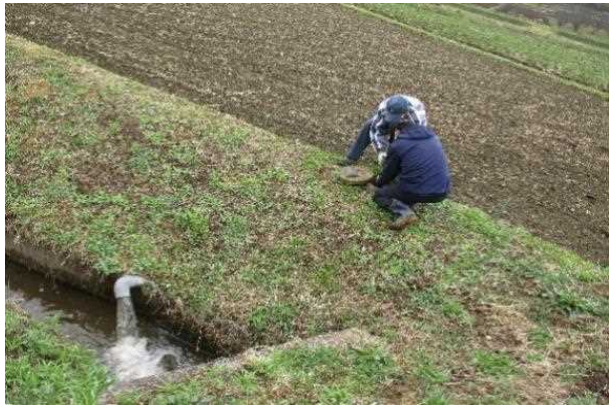
【時期】4月 【内容】 パイプライン等農業施設の点検を実施した。